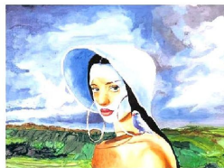
Ekavart Gallery - Murat Berköz, Genel Doğu, kağıt üzerine yağlıboya, 44 x 55 cm, 2022

Disiplinler arası bir seçki sunacak HOMEMADE