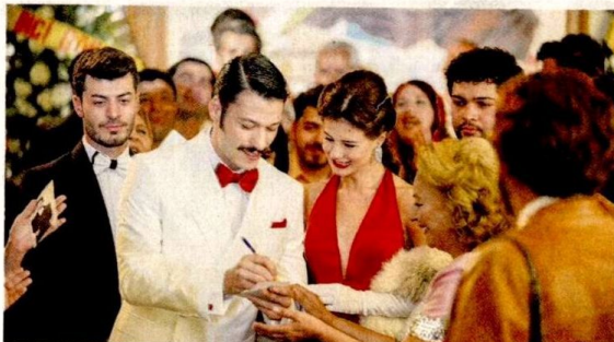
"Sevda Mecburi İstikamet"