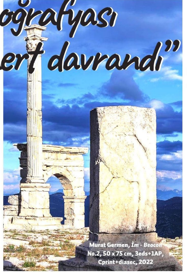
Murat Germe, İm - Beacon No.2, 50 x 75 cm, 3eds+1AP, Cprint+diasec, 2022

Ziyareti gerçekleştirmeden önce antik kentin tarihine yönelik araştırma yaptım. Bu benim belge odaklı bir çalışma yapmadan önce her zaman izlediğim bir yöntem. Serginin kapsamına göre 2-3 günden 2-3 haftaya kadar