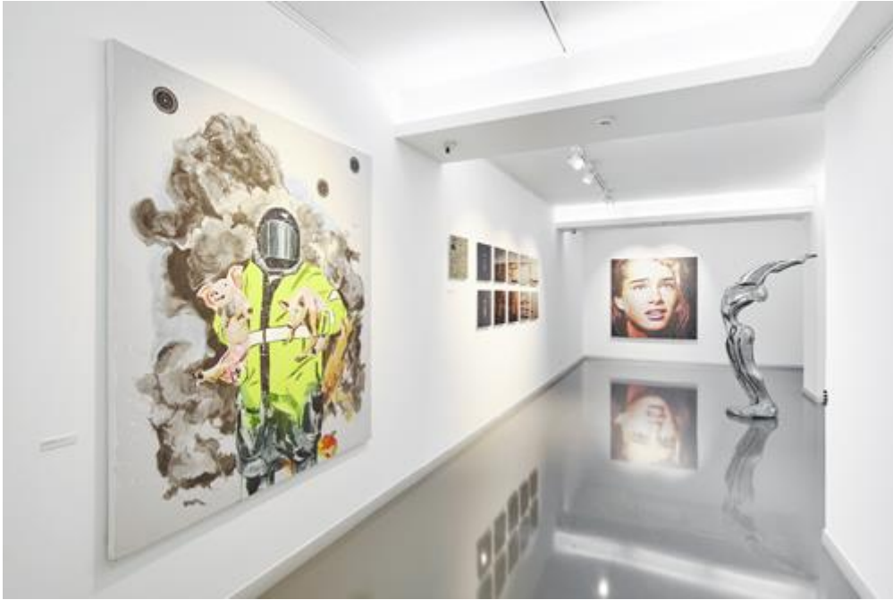
Bozlu Art Project Nişantaşı, Korku (Karma Sergi), 21 Haziran - 31 Ağustos 2016

Bozlu Art Project, uzman sanat tarihçilerinden oluşan deneyimli kadrosu ile verdiği sanat danışmanlığı hizmetini kurumsal işbirlikleri ile sürdürerek, birlikte çalıştığı sanatçıların yapıtlarını Acıbadem Sağlık Grubu, Allianz Sigorta, ING Bank, HSBC Bank, Globus Yapı, Tünel Residence, Neolife Bükreş Hastanesi, The House Residence, Ankara Güven Hastanesi gibi kurumsal sanat projeleriyle buluşturdu.