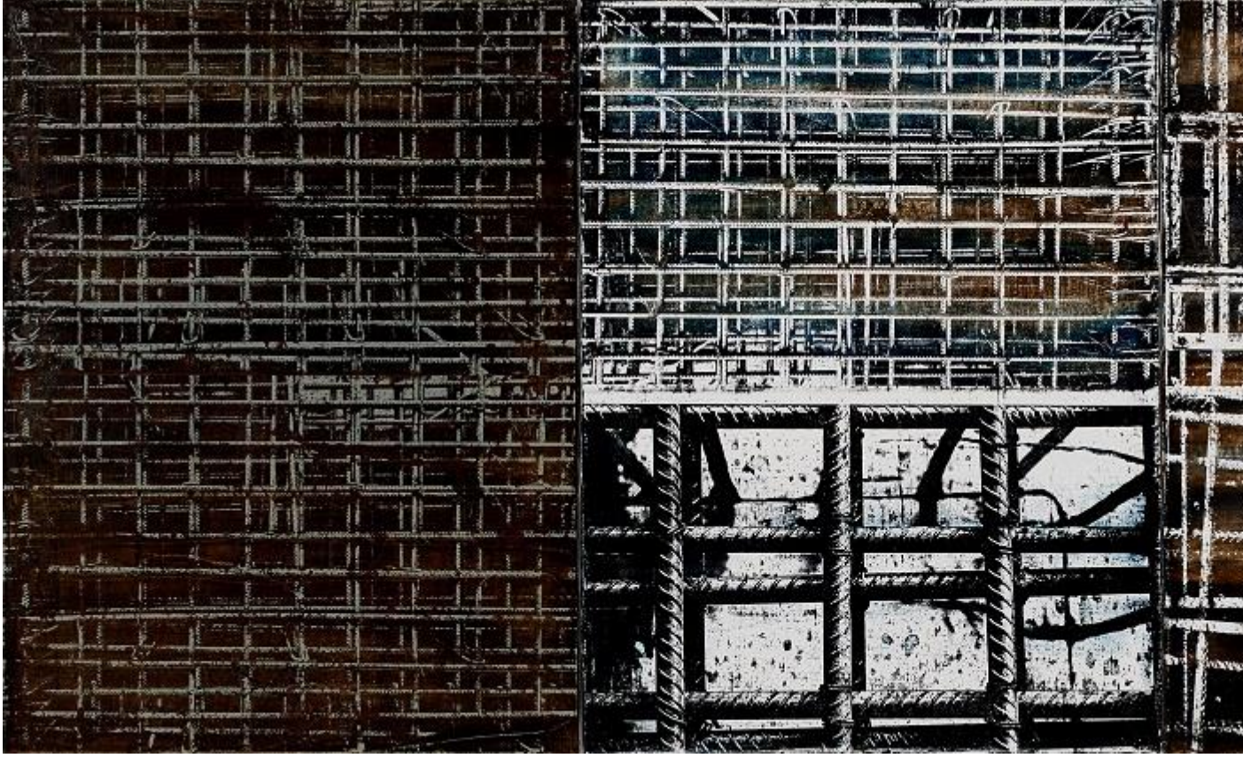
Semih Zeki, Asylum, 2018, tuval üzerine karışık teknik, 50 x 38 cm (x3)