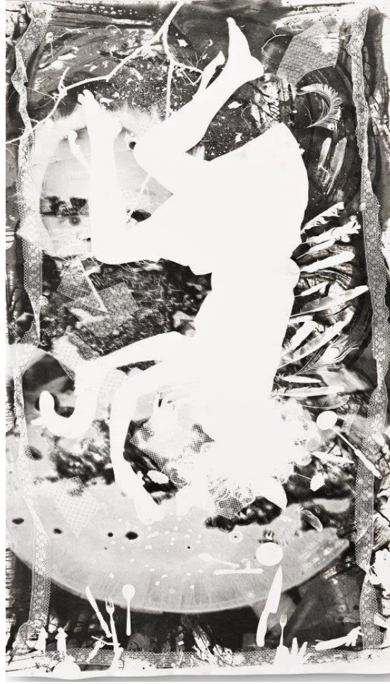
İlgen Arzık, Ambrosia, 2018, Fotogram, 243 x 122 cm