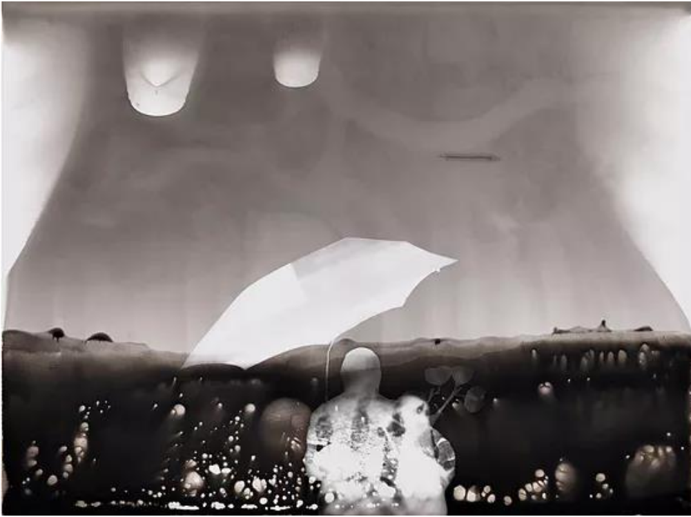
İlgen Arzık, Resim Çekmek II, 2018 , Fotogram, 17.8 x 24 cm

Bilinir ki politik zulmün arttığı zaman dilimlerinde klasikleşmiş temsil modelleri geri çağrılır. Toplumsal siyasal yapı tek bir gövde etrafında sağlam kökleri (hayaletleri) çağıran söylemler tarafından işgal edilir. Teklik, birlik siyaseti hegemoniktir.