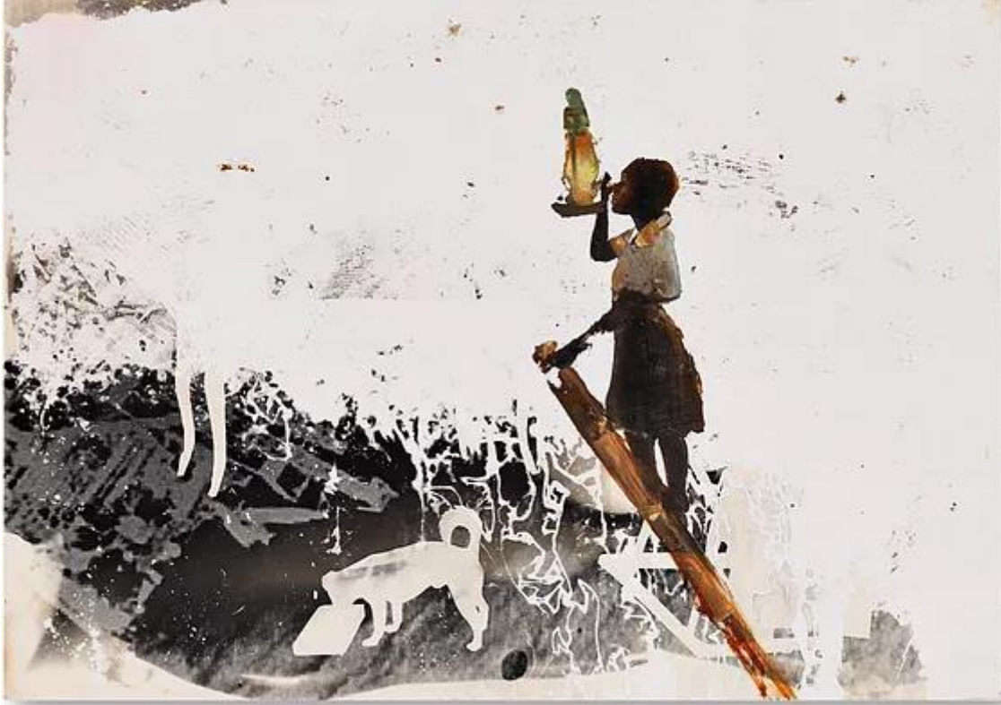
İlgen Arzık, İsimsiz, 2014, Fotoğraf kağıdı üzerine karışık teknik, 21x 29.7 cm

Sanatçı, soyut dışavurumcu ve gerçeküstücü bir anlayışı buluşturduğu siyah-beyaz ağırlıklı yapıtlarında, çeşitli bilgi ve imaj kaynaklarını kendine çıkış noktası alıp dijital kültürün hegemonyası altındaki günümüz dünyasında, görüntü ve anlatının kendini türetebilme ve kalıcılık imkânlarını araştırıyor. Gerçek Bir Hikâye 'yi Mahmut Wenda Koyuncu değerlendirdi