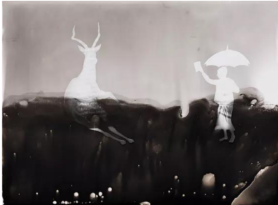
İlgen Arzık, Resim Çekmek I, 2018, Fotogram, 17.8 x 24 cm

"Sıra dağlar, platolar ve vadilerin yayıldığı uzamda eriyik hale gelmiş bir topografyanın yakın planına gündelik hayattan nesnelere, lekeler ve hayaletler yerleşir."