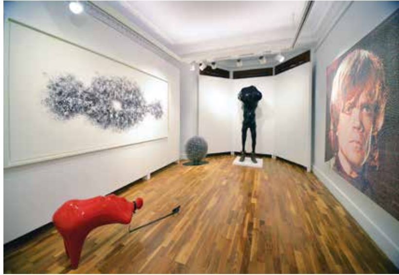
Bozlu Art Project Mongeri Binası Sergi Salonları.