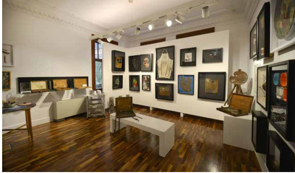
Bozlu Art Project 'Sanatçı Atölyeleri' Koleksiyonu