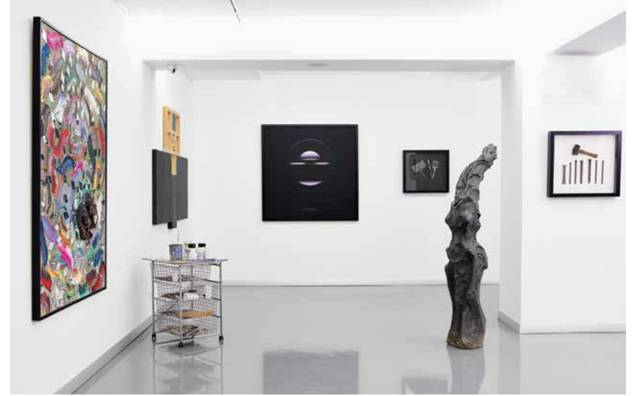
"Bağlantı" sergisi, 2013. Bozlu Art Project Nişantaşı.