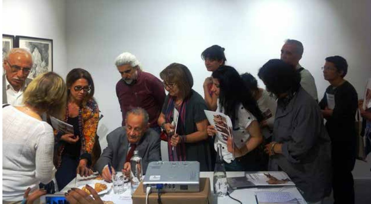
Aloş sanatçı konuşması, 2014. Bozlu Art Project Nişantaşı.