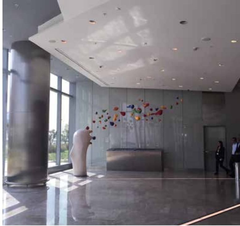
Evren Erol, Uçarı Düşler, 2015, Allianz Projesi