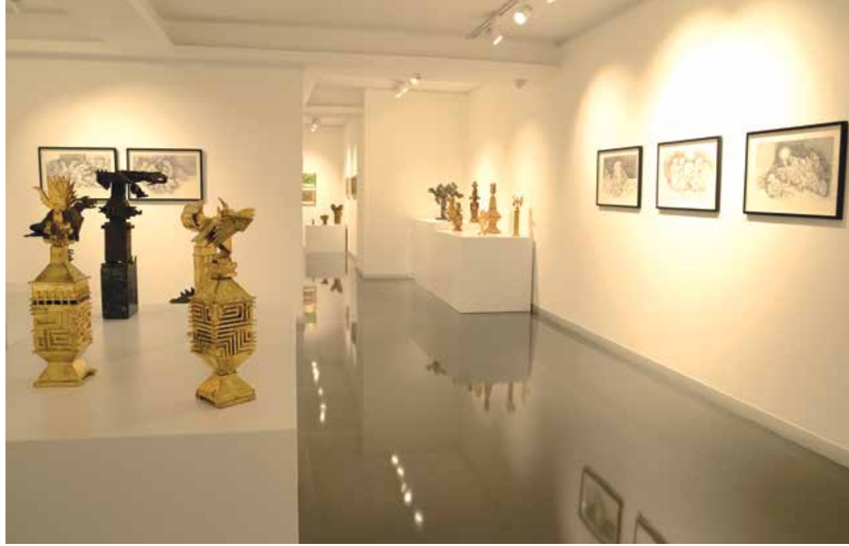
Aloş "Desenler, Resimler ve Heykeller" sergisi, 2015.