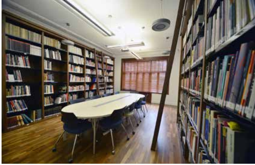
Bozlu Art Project Şişli Kütüphanesi.

binin üzerinde yayın mevcut. Osmanlı dönemi, Cumhuriyet dönemi veya sonrasında zaman zaman eleştirilere maruz kalan sanatçılarımızın hangi koşullar altında o eserleri ürettiğini ortaya koyabilmek bizim için önemli. Kendi tarihimizi iyi bilirsek bugün yapılanları daha iyi anlamlandırabilir ve açıklayabiliriz. Herhangi bir bilgi ortaya koymadan yapılanı eleştirmek her zaman çok basittir; yeni belgeler ve yayınlarla bu alandaki eksikliğin giderileceğine inanıyoruz.