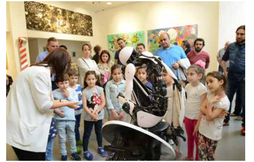
Bozlu Art Project Şişli'de çocuk atölyesi, 2015.