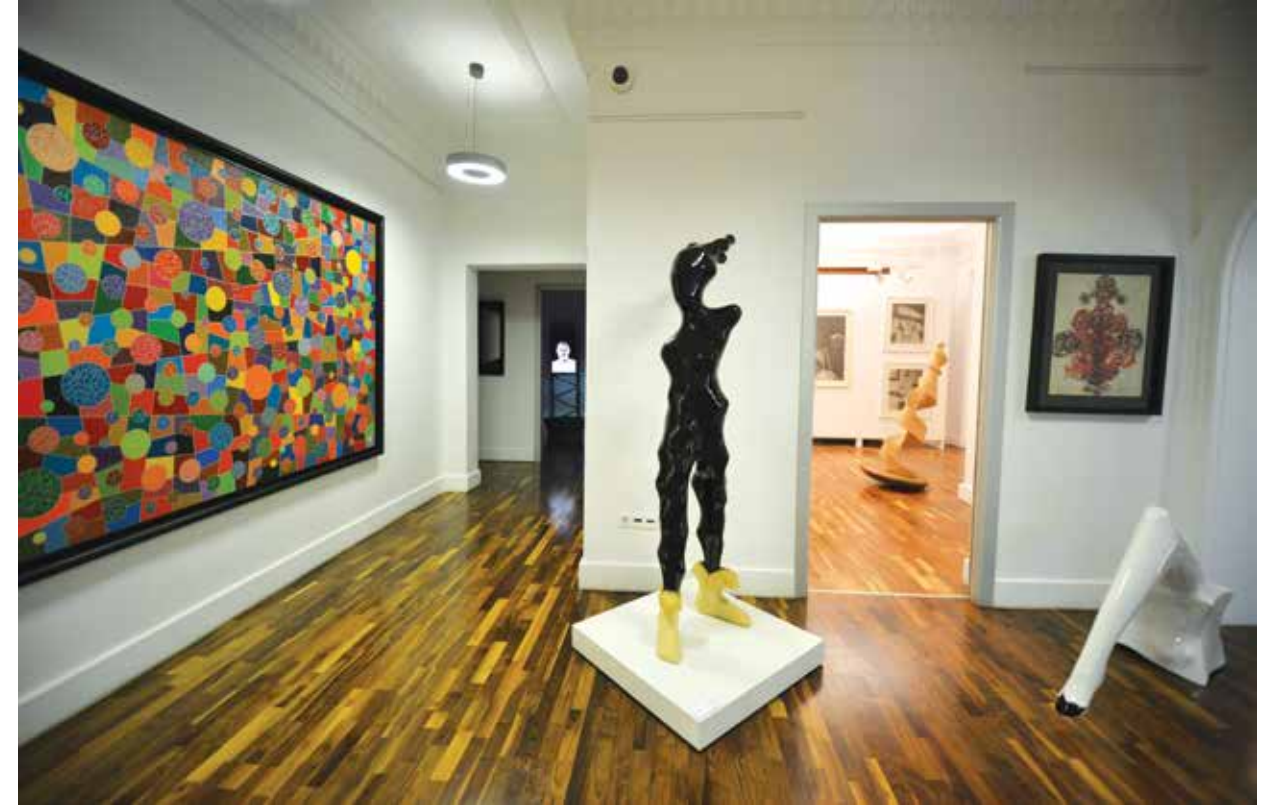
Bozlu Art Project Mongeri Binası Sergi Salonları.

Art Project'in vizyonunun belirlenmesinde büyük etkisi var. Akademik alandaki çalışmalarımız esnasında Türkiye'de yıllardır eksikliğini hissettiğimiz bilgi ve belge boşluğuna bir katkıda bulunmayı ve bu alana yeni bakış açıları kazandırmayı amaçladık. Bozlu Art Project çok yönlü bir sanat projesi diyebiliriz. Nişantaşı'ndaki galerimiz bu projenin sadece bir ayağını oluşturuyor. Galeri bizim görünen yüzümüz ve vitrinimiz. Bu mekânda daha çok kişiye sesimizi duyuruyor, temsil ettiğimiz sanatçıların merkezi bir yerde görünürlüğünü sağlıyor ve eserlerinin geniş kitlelere ulaşmalarını sağlıyoruz. Nişantaşı'ndaki galerimizde 2013 yılından bu yana düzenlediğimiz sergiler ve bu sergiler için hazırlanan sergi katalogları, belgeseller ve sanatçı konuşmalarıyla bir anlamda vizyonumuzu da sanatseverlerle paylaşmış olduk. Örneğin sanatçıların yapıtlarıyla, atölyelerinde kullandıkları palet, fırça, boya sandığı gibi malzemeleri bir araya getiren,