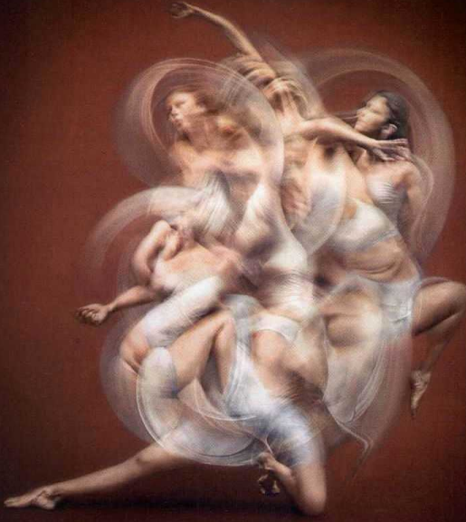
Sanatçının "Melez Ruhlar #1" isimli çalışması.