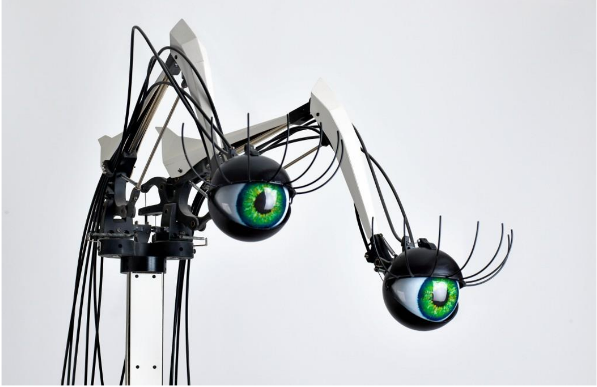
Server Demirtaş, Gözler II, 210x55x70 cm, motor, mekanik sistemler, demir

HG: Akademi’de resim eğitimi alıyorsunuz ama ilk zamanlarda yaptığınız işlerde bu tarz kinetik çalışmaların olmasa bile hep üç boyut (3D) meselesi var. Niçin resimden 3D’ye geçtiniz?