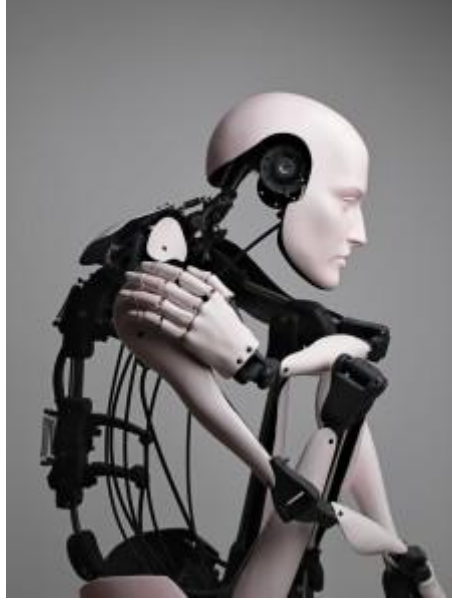
Server Demirtaş, Düşünen Kadın

HG: Heykelleriniz sizin deyiminizle “eski teknoloji” metodları içeriyor. Biraz teknik ve çalışma prensibinden bahsedebilir misiniz?