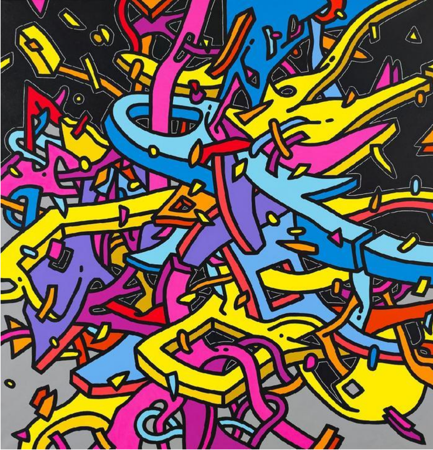
Soyut serisi - Çekim Kuvveti