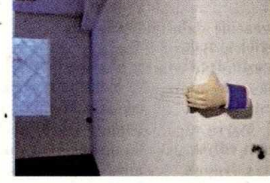
Histeri Evren Erol

Berlin merkezli 'Slavs and Tatars' sanat kolektifinin son 10 yıldaki üretimlerinin kapsamlı bir seçkisi niteliğindeki 'Ağızdan Ağıza' SALT Galata'da... Ağızdan Ağıza, kolektifin kültürel yorumlamadaki farklılıklar, müşterek dil mirası ile bugünün toplumdaki algısını irdeleyen işlerini bir araya getiriyor. Sergi, 'Slavs and Tatars'ın sunum-performansları, kültürde anlam kaymalarının, dini öğretilerin ve dilsel benzeşmelerin kökenlerinin izini sürüyor. Almanya'da eski Berlin Duvarı'nın doğusu ile Çin Seddi'nin batısı arasında kalan Avrasya coğrafyasına dair polemikler ile yakınlıkları inceliyor. 'Ağızdan Ağıza' adlı sergi 27 Ağustos'a dek sürecek.