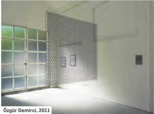
Özgür Demirci, 2011