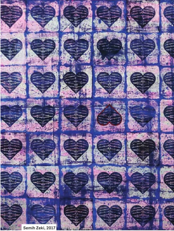
Semih Zeki, 2017