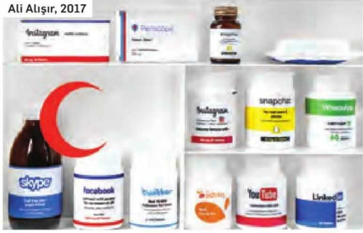
Ali Alışır, 2017